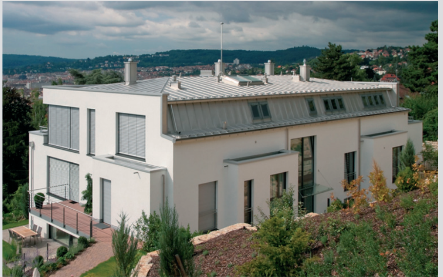
Blitzschutz nach Klasse 2 – mit nur einer Fangeinrichtung und einer Ableitung, die durch die Villa führt (weitere Beispiele: www.leutron.de/aeusserer-blitzschutz.html )

Im Gegensatz des konventionellen Franklin-Systems, das auf reine Naturbeobachtungen und theoretischen, nicht mehr zeitgemäßen Grundsätzen beruht, basiert das System 3000 auf streng wissenschaftlichen Grundlagen und Ergebnissen langjähriger Feldversuche nach dem neusten Stand der Technik.