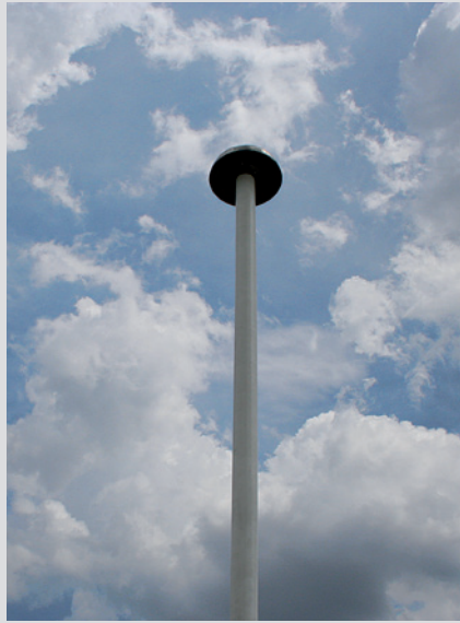
Blitzschutz vom Nachbargebäude aus

Die Berechnungen zeigten, dass ein einziger Mast mit Fangeinrichtung ausreicht, um das gesamte Gebäude zu schützen. Mit dieser Anordnung konnte ohne zusätzliche Kosten sogar Blitzschutzklasse 2 erreicht werden – eine höhere Sicherheitsstufe als gefordert.